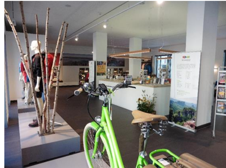
Aktivzentrum Bad Schandau